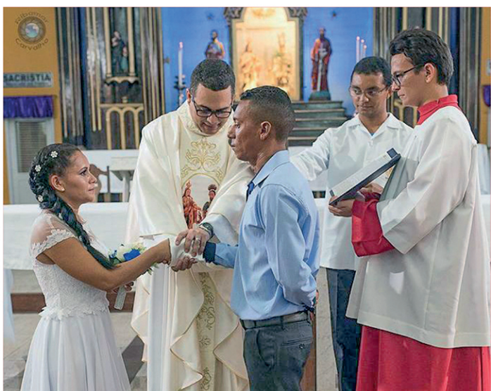
Santuário celebra casamento comunitário